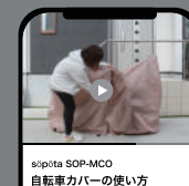
söpöta SOP-MCO 自転車カバーの使い方