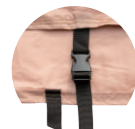
風飛び防止ベルト